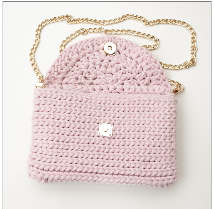
Den rosa vesken er heklet i kun Tubegarn (TB107), magnetknapp i gull (K7678) og satt på et veskekjede i gull (VH1014).